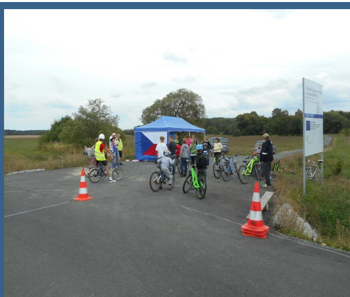
Sprint day 8.9.2019 na cestě na Březí Organizátor: Athleticclub Ctiboř

Nově je u hasičárny popelnice na jedlé oleje. Odevzdávejte je v plastové lahvi.