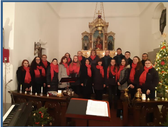
Vánoční koncert v kapli Božského srdce Páně ve Ctiboři 30.11.2019