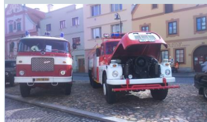
Ctibořská Tatra na výstavě veteránů v Plané 28.9.2019