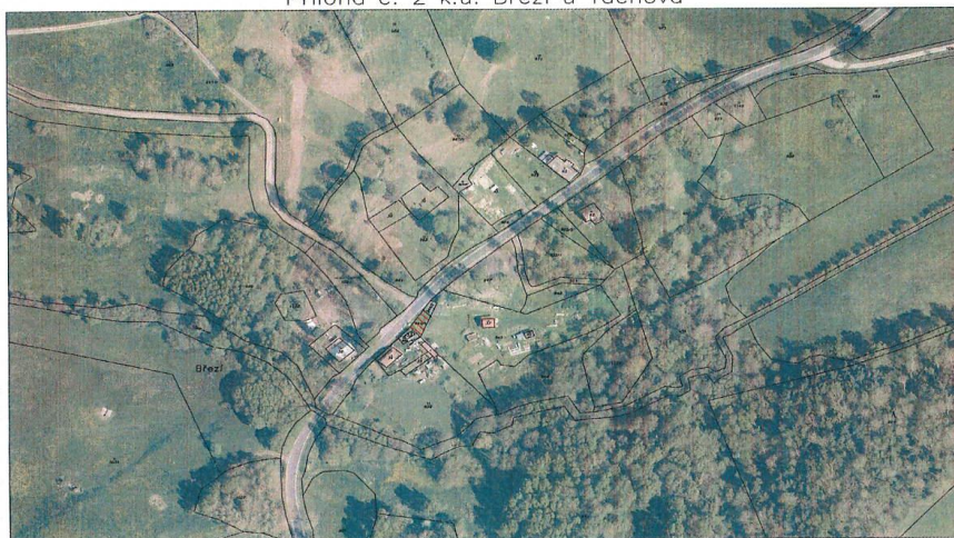
Příloha č. 2 k.ú. Březí u Tachova